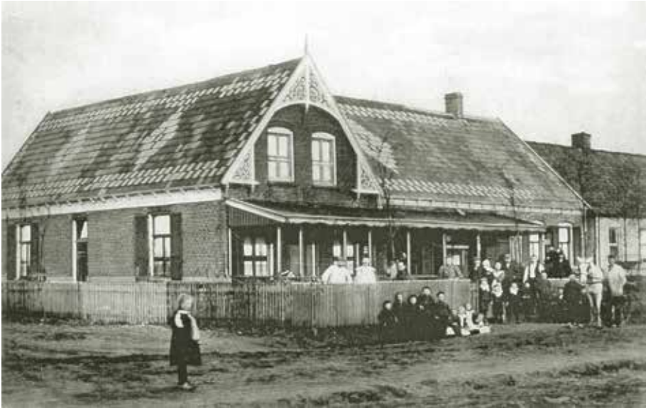
Café Knol rond 1900.

De zaken gaan voor de wind en in 1906 zijn er al weer plannen voor het bouwen van twee woningen. In 1909 worden drie blokken van twee (6) woningen gerealiseerd op perceel K 1528 en twee blokken van twee (4) woningen op perceel K 1566.