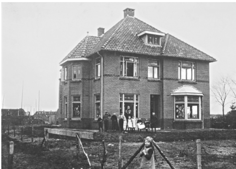
Villa Knol, waar nu de Zusters wonen.