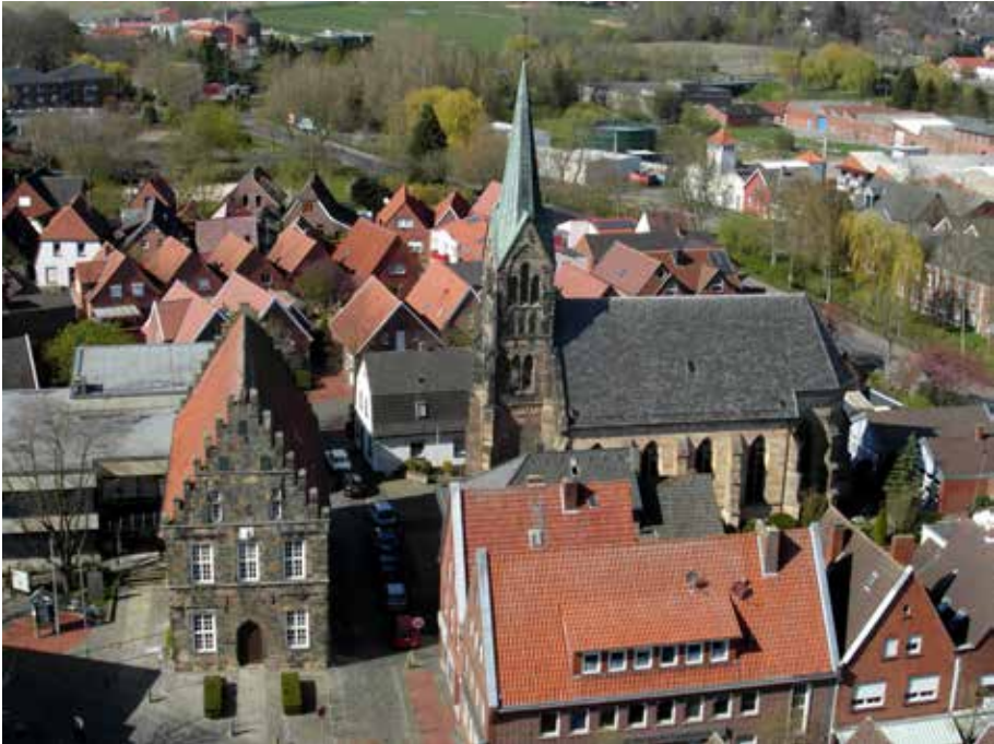
Panorama van Schüttorf met het laatgotische raadhuis uit de 15 e eeuw en de r.k. neogotische Mariakerk (1867). De foto werd gemaakt vanaf de hoge toren van de protestantse kerk door Andries Kuperus.