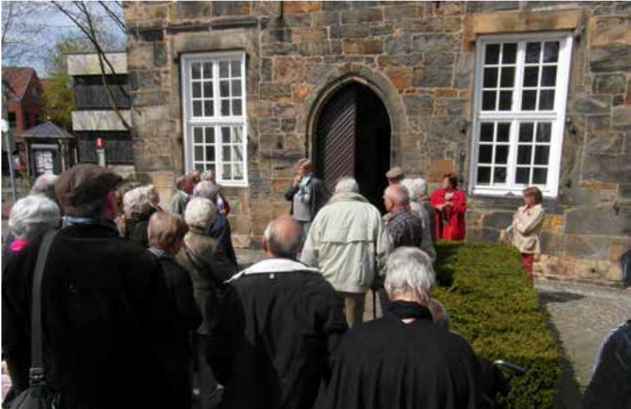
Links naast de ingang, op ooghoogte in de muur 'de el van Schüttorf'.

De stadsmuur, natuurlijk ook van Bentheimer zandsteen, was aanvankelijk tot tien meter hoog en één tot twee meter breed met slechts drie stadspoorten en een kleine toegangspoort. Zo'n 550 meter muur staat er nog, zij het meermalen onderbroken en vaak niet meer als zodanig te herkennen.