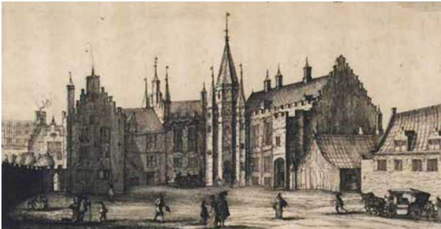
Het bisschopshof in Utrecht. (Tekening van G. Roghman van circa 1650).

Op dat moment, 1342, was de toestand van het bisdom zorgwekkend. Financieel zat het bisdom aan de grond. Maar Jan van Arkel bleek een goed strateeg en ook een goed diplomaat te zijn. Hij wist de opstandige edelen weer in het gareel te krijgen en de ruzies met de burenen te beslechten. Maar ja, zo iets kost veel geld. Als gevolg daarvan kon hij zijn dure hofhouding niet meer bekostigen. Hij liet zijn broer Robert in 1343 achter als zijn plaatsvervanger in Utrecht en vertrok naar Grenoble. Daar had hij genoeg aan één bediende, één secretaris en één maitresse.