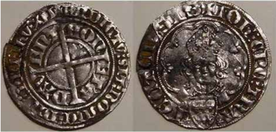
Zilveren Kwart Groot met de beeltenis van Jan van Arkel.

Op dat moment, 1342, was de toestand van het bisdom zorgwekkend. Financieel zat het bisdom aan de grond. Maar Jan van Arkel bleek een goed strateeg en ook een goed diplomaat te zijn. Hij wist de opstandige edelen weer in het gareel te krijgen en de ruzies met de burenen te beslechten. Maar ja, zo iets kost veel geld. Als gevolg daarvan kon hij zijn dure hofhouding niet meer bekostigen. Hij liet zijn broer Robert in 1343 achter als zijn plaatsvervanger in Utrecht en vertrok naar Grenoble. Daar had hij genoeg aan één bediende, één secretaris en één maitresse.