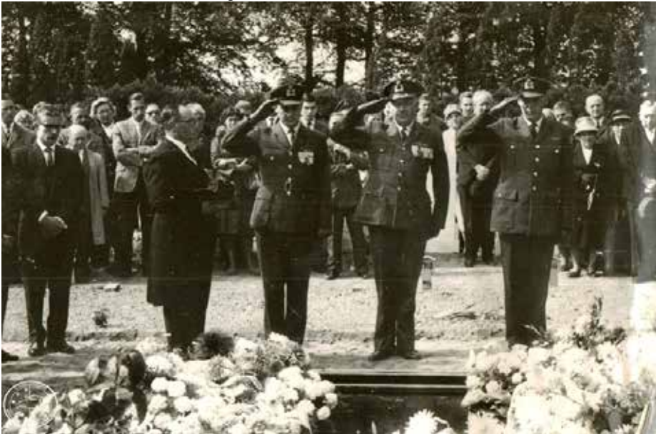
Wily is begraven op de begraafplaats Moscowa in Arnhem.

Voorgaand artikel heb ik bewust overgenomen omdat een enkele krant veronderstelt, dat Wily te lang in het toestel is gebleven om bebouwing te ontwijken. Dit kan gezien de enorme snelheid en het feit dat het toestel al was gekanteld onmogelijk het geval zijn geweest. Naar later bleek ontbrak hem domweg de tijd om te handelen en kwam men er na deze eerste crash pas achter hoe snel het toestel kon vallen. Het feit dat hij de Basis toch nog heeft kunnen inlichten mag dan ook een wonder heten.