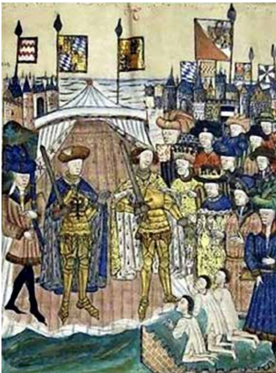
Vergiffenis vragende Utrechters.

Jan had zich inmiddels verzekerd van de steun van de steden Utrecht, Kampen, Deventer en Zwolle en had de weg omhoog weer gevonden. Maar de torenhoge schulden bleven en hij vertrok ten tweede male naar Grenoble. Een jaar later bleek dat toch ook niet de oplossing van zijn problemen te zijn en in 1352 kwam hij terug en begon zijn bezittingen te verpanden.