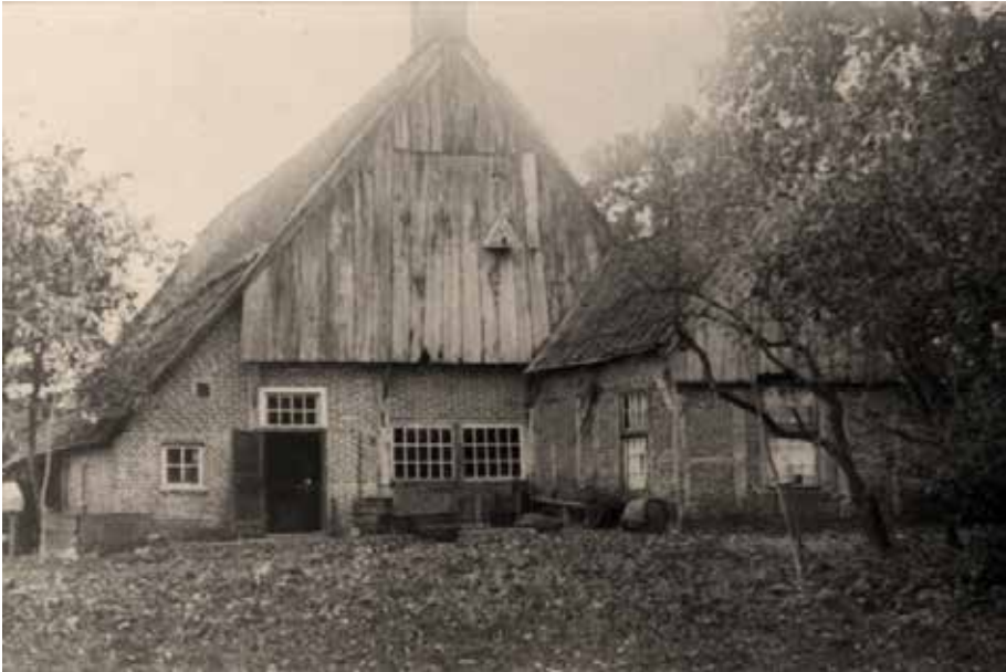
Het gewaarde erve De Kolker was een prachtige boerderij met bovenkamer.