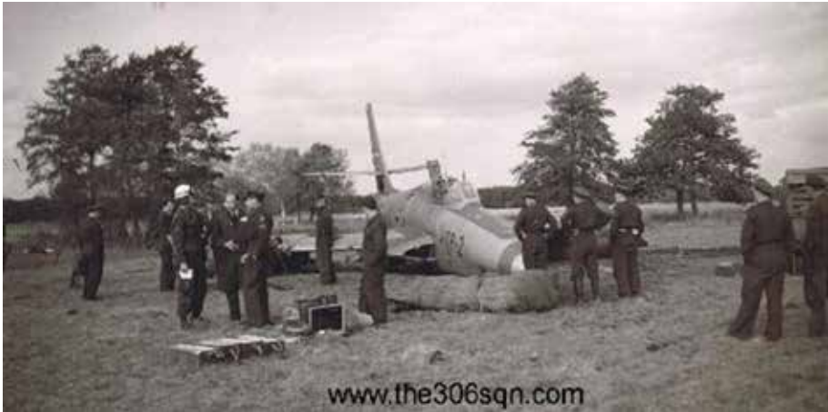
De RF-84 na de fabuleuze 'noodlanding' in de buurt van Venray.