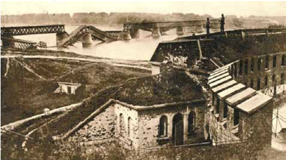
Warschau en Fort Légionow vlak na de Duitse invasie van Polen.

Een Frontaufklärungstrupp (FAT) was ontwikkeld aan het begin van de oorlog, toen bleek dat vlak achter het front vaak een schat aan informatie te vinden was. De fronttroepen waren echter bezig met hun gevechtstaak en bovendien niet geschoold om belangrijke informatie in alle gevallen te herkennen. Daarom werden speciale kleine eenheden geformeerd (rond de twaalf man), die onder de Abwehr (Duitse inlichtingendienst) hun werk deden. Deze eenheden, FAT genaamd, hielden zich bezig met het opsporen van informatie die belangrijk was voor de legerleiding. Zij hielden zich ook bezig met het opsporen van spionnen en informanten van de vijand en het ontmantelen van verzetsgroepen. Een FAK (Frontaufklärungskommando) stuurde meerdere FAT 's aan.