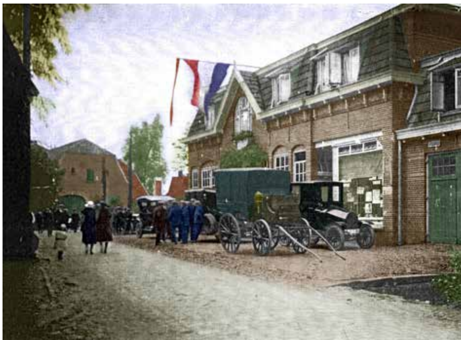
't Hotel S. in Losser

In 't Hotel S. waren ook eenige Duitschers, die een wagon margarine wilden koopen, doch de betaling zou eerst volgen, wanneer de margarine over de grens was. Daarop ging de verkoper niet in, alhoewel deze Duitschers bereid waren bankgarantie te stellen. Ik mag niet uitvoeren, was het antwoord dat ze kregen, want ik heb een N.O.T.-verklaring getekend. Maar dezelfde man mag ook niet aan anderen verkoopen, zonder de teekening der bekende N.O.T.-verklaring van den kooper te eischen. De N.O.T. kan hier ingrijpen, wanneer ze wil. Laat eens een bestuurslid van dit lichaam naar Losser komen.