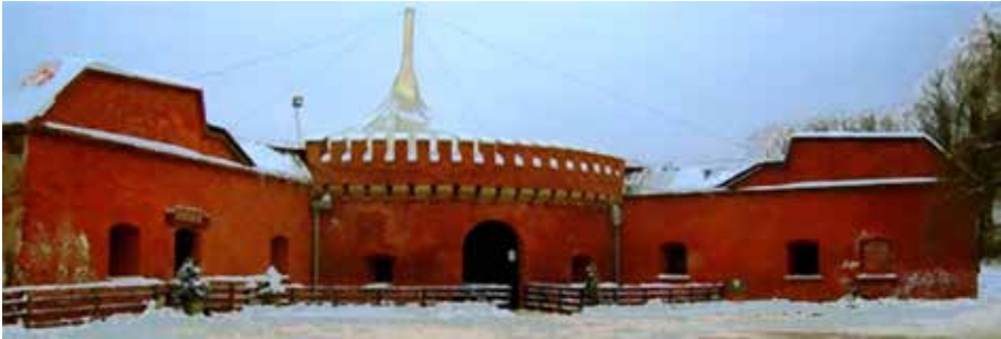
Fort Légnow, momenteel een monument dat veelvuldig wordt bezichtigd.