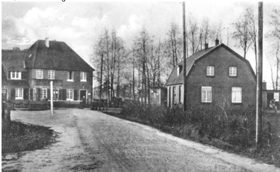
Grenspost Tiekerook in Overdinkel. (Deze foto heeft als voorbeeld gediend voor het schilderij dat op de omslag van dit boekje is afgebeeld).

De militaire commandant te Losser verzekerde mij, dat de militairen geen margarine doorlaten, d.w.z. over de hoofdweg. In het veld, ja, daar is geen doen aan. Aan den eenen kant staat de verkooper en aan den anderen kant van de grens de kooper. Zoolang de margarine nog op Hollandsch gebied is, mogen de militairen niets doen. Bovendien is de uitvoer van margarine niet verboden. De commiezen te Glanerbrug treden het strengst op en nemen de margarine in beslag voor monsteronderzoek. Te Glane en Overdinkelscheveld schijnt dat niet het geval te zijn en hebben de commiezen den uitvoer toegestaan, alleen op grond van de meededeling van den vervoerder, dat het margarine betref.