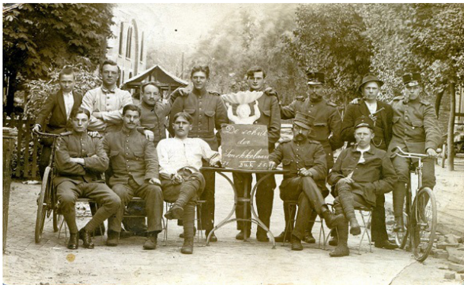
'De schrik der smokkelaars', (vermoedelijk) aan de grens in Glanerbrug. (1925).

K.G. gaan de grens over. De zendingen worden hoofdzakelijk te Losser aangevoerd, doch ook te Oldenzaal en Enschedé. Vanuit laatstgenoemde plaats gaat het per as en per electr. tram naar Glanerbrug.