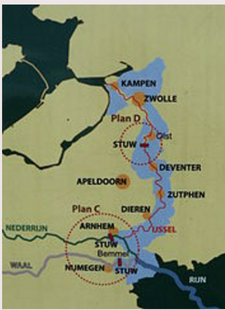
Kaart ; CC-BY-SA 4.0 Zandee

Kaart van de IJssellinie met daarop aangegeven de drie stuwen en in lichtblauw het inundatiegebied. Kaart gezien op informatieborden bij de IJssellinie op het landgoed De Haere in Olst.