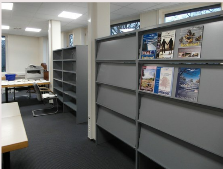
De boekenkast en tijdschriftenkast