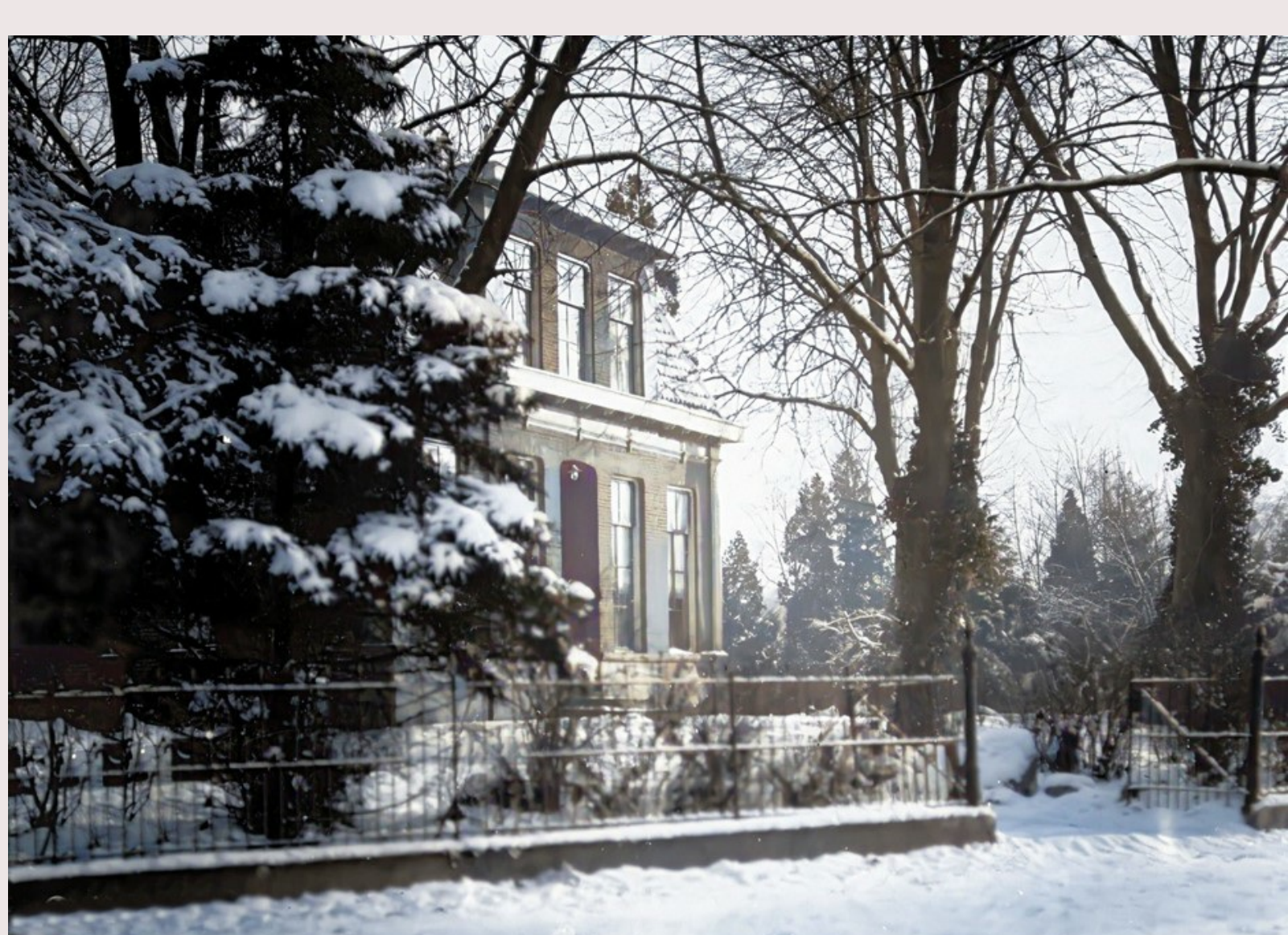
De Hervormde pastorie, nu Raadhuisplein.

Het bestuur en de vrijwilligers van de Historische Kring Losser wensen u: Prettige Kerstdagen en een gelukkig en gezond 2023