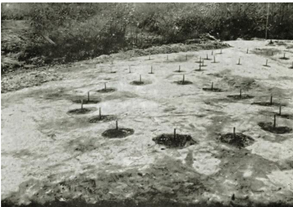
foto's: De paalgaten van de hutten van de Losserse nederzetting