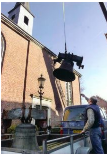
Een actiefoto van het verwijderen van de klokken uit de toren van de hervormde kerk op 02-02-02.

Wat achterbleef was het, enkele jaren geleden door vrijwilligers geheel gerestaureerde, uurwerk dat er