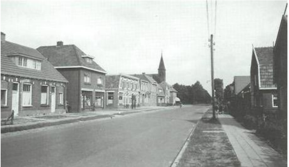
Een nieuwe langgerekt dorp is hier ontstaan: Overdinkel.

verzekeren. Nagenoeg allen hadden het arm gehad en kwamen hier door de flinke lonen op een voor hen onbekend levenspeil. Gronau's schoorsteenpijpen en massale fabrieksblokken, huizen en torens, op tien minuten of een kwartier afstand van de grens gelegen, ziet men vlakbij, wanneer men zich op Overdinkels gebied bevindt.