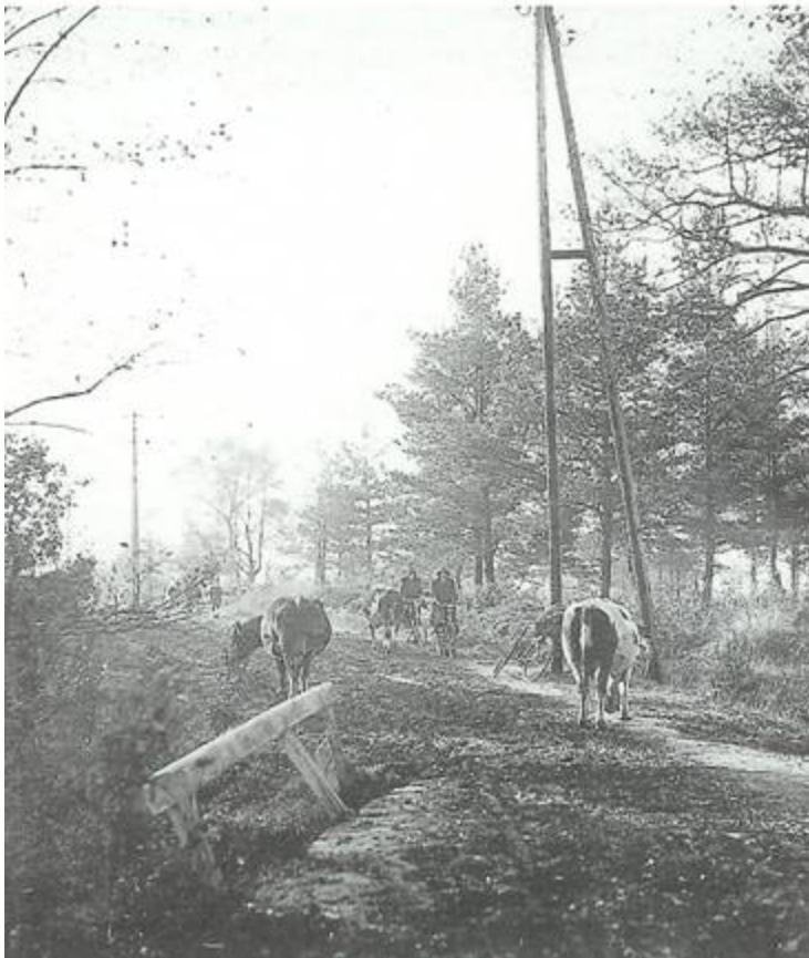
De weg de Beekhoek, dus naar Glane/Gronau en Glanerbrug, in 1924