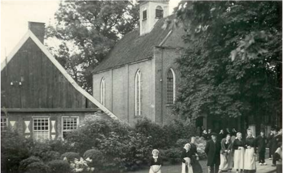
Een sfeervol plaatje van de omgeving van de hervormde kerk en het "Bekhoes" (nu Aleida Leurinkhuis) tijdens een Twentse feestweek (ca. 1950).