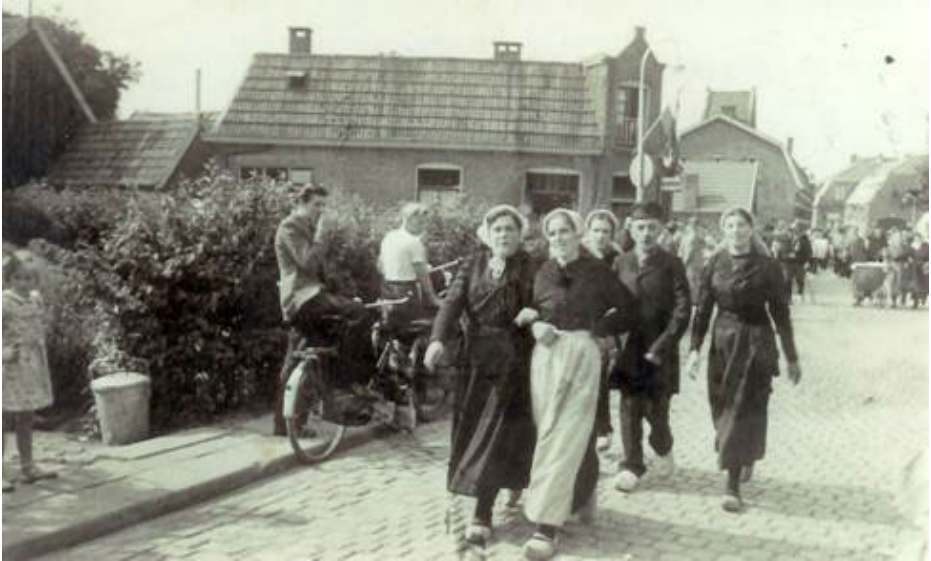
Zo zag het straatbeeld (de Brinkstraat) er uit tijdens één van de Twentse feestweken (ca. 1950).

rondgang door het dorp gemaakt met als einddoel de grote feesttent aan de Spoorstraat. Hier werd de grote krentewegge aangesneden en men dronk koffie uit ouderwetse boerenkoppen”.