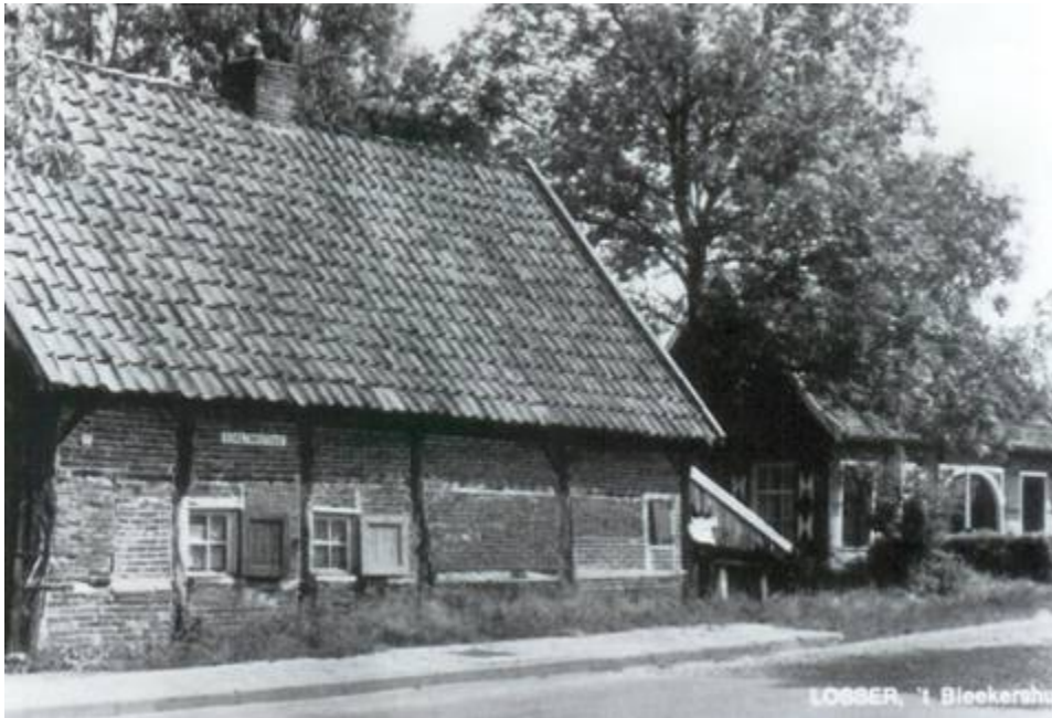
Het bleekwachershuisje zoals het er uitzag vóór de restauratie