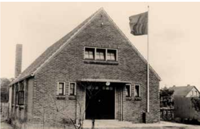
Deze foto werd gemaakt bij de opening. Als er in 1933 al kleurenfoto's waren geweest hadden we kunnen zien hoe fier de rode vlag toen wapperde.

Ter opening hijst H. Lindeman van het N.V.V. de rode vlag en met enkele treffende woorden opent hij het gebouw. Hierna wordt spontaan de 'Internationale' ingezet.