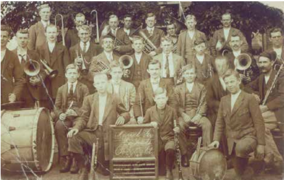
Muziekvereniging 'De Eendracht'.

Tussen 10 mei en 4 september zijn er nog twee vergaderingen en men is druk met de verloting. De te winnen prijzen waren best fors voor die tijd: een Amstel- of Germaanrijwiel naar keuze, een wasmachine, een divan, een elektrisch strijkijzer. Allemaal artikelen, die een gemiddeld gezin in die crisistijd zeker niet in huis had. En dan waren er ook nog 21 waardevolle troostprijzen. Op 10 augustus vindt de trekking plaats, maar het is niet bekend wie de gelukkigen waren. Tijdens de verkoop van de loten had B. Reuvers een ongeluk met de fiets gehad. De reparatiekosten waren f 1,70, maar er werd besloten hem een vergoeding van slechts f 1,00 te geven. De stand van zaken met betrekking tot de verloting is gelukkig positief. Van de 3000 loten waren er 2367 verkocht.