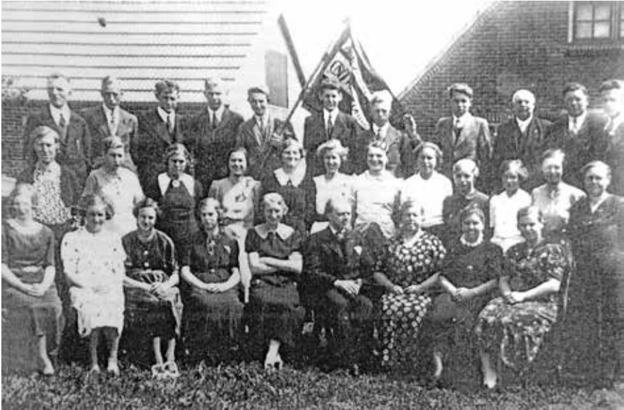
Zangvereniging 'Ontwaakt'. Rechtsachter een deel van de gevel van 'Ons Huis'.

De opening wordt door een groot aantal afgevaardigden van de verenigingen bijgewoond en verschillende mensen voeren het woord. Gezien de lijst met maar liefst achttien sprekers, van nu deels onbekende organisaties, moet het een hele zit zijn geweest.