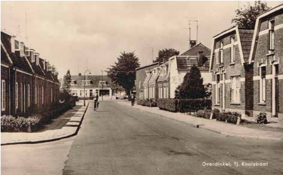
Kruising Julianastraat/Tjibbe Knolstraat, op deze foto al afgebouwd. De 'bult zand' is verdwenen.

Foto's die mooi weergeven hoe Overdinkel veranderde in een mensenleven.