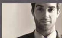
Bedrijf & Beroep