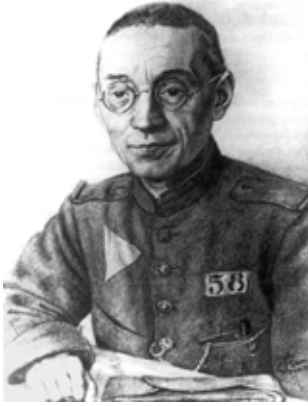
Titus Brandsma, getekend door een medegevangene (in kamp Amersfoort)

en gedreven en leden onder honger, ziekte, slechte hygiënische omstandigheden, terreur en de vaak dodelijke experimenten van SS-artsen.