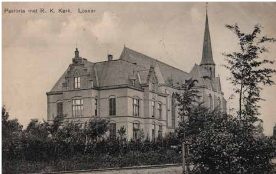
De H. Maria Geboortekerk

De zielzorg van ons kapelaans ging gewoon door. Ieder jaar werd in alle gezinnen huisbezoek gedaan. Zolang de scholen open waren werd er catechismus gegeven. Voor de schoolvrije jongens tot zeven jaar hadden we een H. Familie opgericht, voor de meisjes van die leeftijd een Maria-Congregatie.