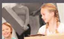
Huis & Hypotheek