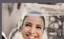
Familie & Relatie