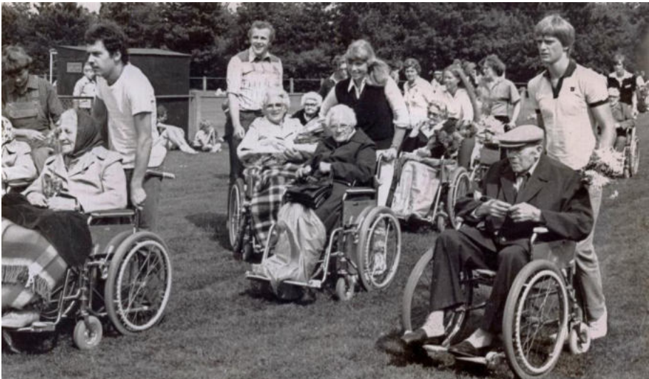
Avondvierdaagse 1979. Van het inschrijfgeld werd in dat jaar per deelnemer een kwartje bestemd voor de UVV, met name voor Tafeltje-dek-je. Het leverde maar liefst duizend gulden op.

Een andere activiteit waaraan de UVV een belangrijke bijdrage levert is de Losserse Avondvierdaagse. In het afgelopen jaar, in juni, konden 39 bewoners van het VVTO in hun rolstoel onder begeleiding van de vrijwilligers ge-