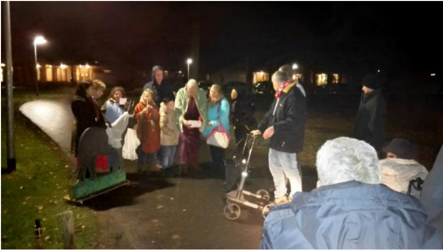
Vrijwilligers ervaren ook de jaarlijkse Adventstocht op de Losserhof als heel bijzonder. Bovenstaande foto is gemaakt in 2016.