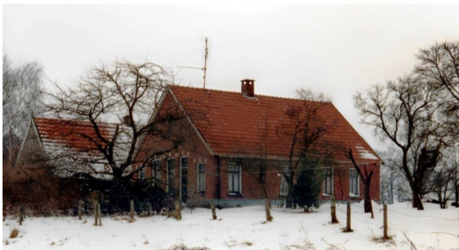
Woning Goormatenweg 1, Overdinkel