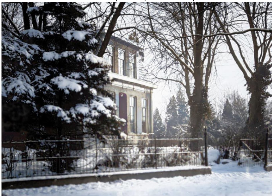
De Hervormde pastorie, nu Raadhuisplein.

Het bestuur en de vrijwilligers van de Historische Kring Losser wensen u: Prettige Kerstdagen en een gelukkig en gezond 2023