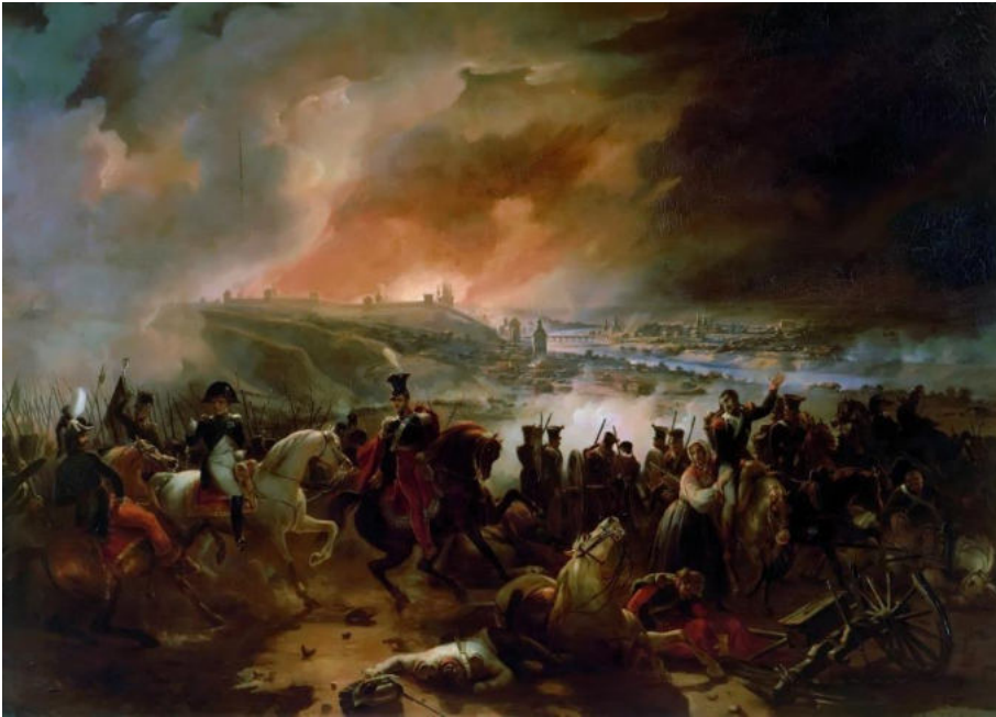
De slag bij Smolensk in 1812, geschilderd in 1839 door Jean Charles Langlois.